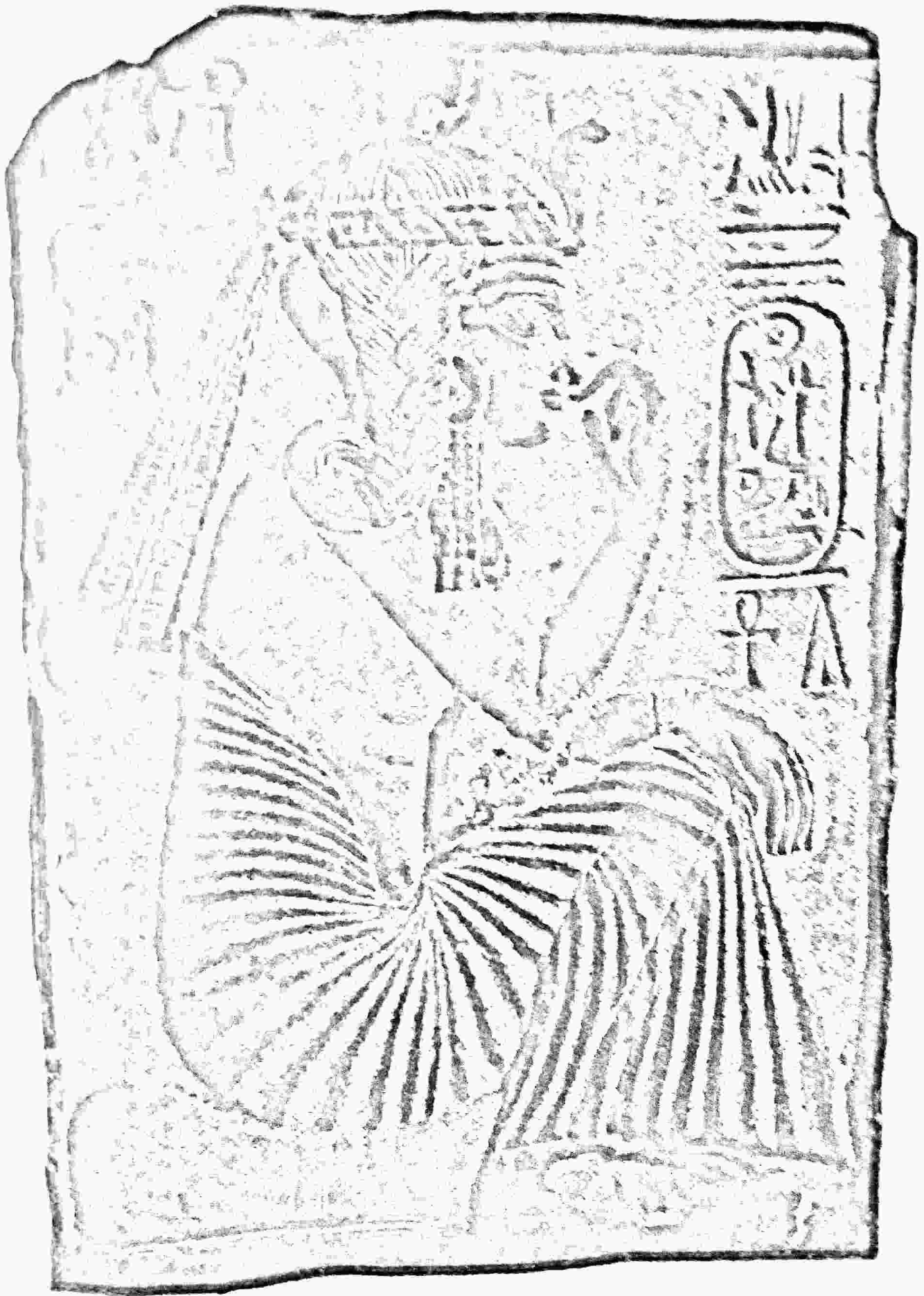
Ramsés II representado como criança.