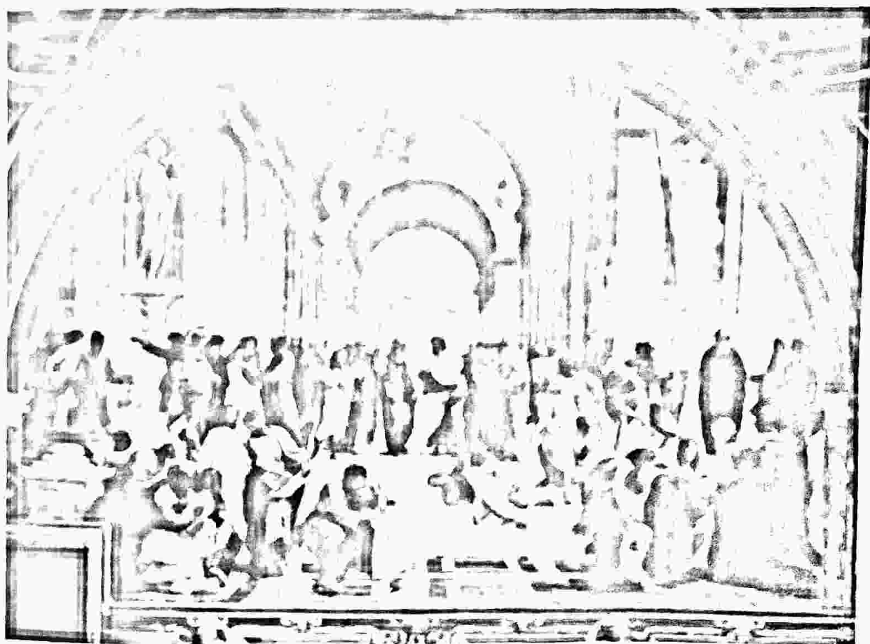
Rafael — Escola de Atenas — Roma.

Outra obra importante desse arquiteto foi a sacristia de San Lorenzo, em Florença. Nela observamos seu gosto pela simetria quando aparecem janelas falsas dispostas ao lado das verdadeiras e nas alas laterais da igreja dispõe colunas que, vistas da extremidade, correspondem às colunas da nave. É considerado o pioneiro dos arquitetos renascentistas.