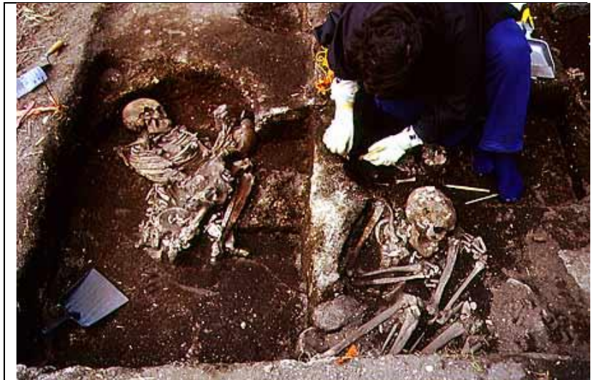
No sambaqui Jaboticabeira-II, pesquisadores já identificaram 80 esqueletos. Todavia, estimativas projetam a existência de milhares de sepultamentos no sítio.

Essa diferença social também está bem marcada no enterramento dos mortos. Em todos os sambaquis existem enterramentos , em maior ou menor número. Alguns sambaquis apresentam uma quantidade tão grande de sepulturas, que podem ter servido apenas como cemitérios. De qualquer forma, os enterramentos apresentam significativas diferenças entre si. Os indivíduos podem ter sido sepultados sozinhos