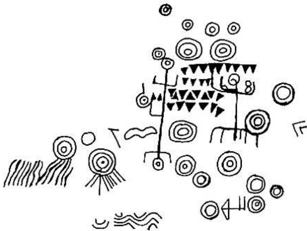
Gravura rupestre identificada na ilha dos Corais, no litoral de Santa Catarina, distante alguns quilômetros da costa: prova da habilidades naval dos sambaquieiros.

Além disso, estudos realizados nos esqueletos mostram que os indivíduos tinham membros superiores mais desenvolvidos que os membros inferiores , como resultado de um uso e esforço centralizado, típico do remo. Estes grupos também deixaram registros no campo da arte. Belíssimas peças de pedra, feitas com a técnica do polimento , foram encontradas nos sambaquis. Apresentam a forma de animais como golfinhos, peixes, aves e antas ou têm forma humana, como é o caso do famoso "Ídolo de Iguaçu", proveniente de um sítio no sul de São Paulo.