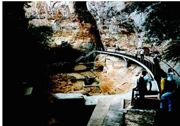
Passarela metálica permite ao visitante do Parque Nacional da Serra da Capivara inesquecível passeio pela arte pré-histórica.

Muitas discussões ocorreram e continuam ocorrendo até hoje. Essas datas colocaram em cheque a teoria da chegada do homem nas Américas, que estimava o início da ocupação por volta de 12.000 anos atrás. Este momento correspondeu ao período final da última grande glaciação terrestre, que formou uma ponte de gelo no Estreito de Behring, unindo o extremo nordeste da Ásia ao Alasca. Grupos de caçadores especializados, acompanhando as manadas de mamutes, teriam passado pela "ponte" e, assim, iniciado a ocupação das Américas. Dos planaltos norte-americanos teriam iniciado sua migração rumo ao sul, espalhando-se por todo o continente e alcançando o Brasil por volta de 10.000 anos atrás.