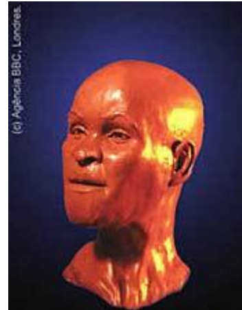
A polêmica Luzia, recentemente apresentada ao grande público: a primeira brasileira.

Das grutas da região, a única protegida por tombamento do IPHAN (Instituto do Patrimônio Histórico e Artístico Nacional) é a gruta chamada Cerca Grande . Ela é considerada importante monumento arqueológico por causa de suas pinturas rupestres e de fósseis descobertos em seu interior, indicadores de antigas culturas existentes em nosso país.