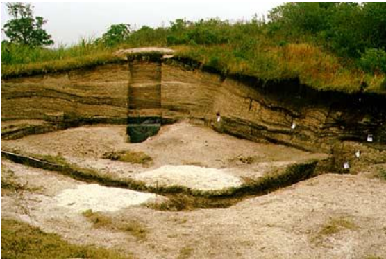
As camadas presentes na parede do sambaqui mostram as diversas fases de sua construção e ocupação.

Os grupos de caçadores e coletores que há pelo menos 15.000 anos ocupam o Brasil começam, neste período, a apresentar um maior crescimento demográfico e a se tornar sedentários. As pesquisas arqueológicas nos mostram evidências de uma organização social bastante forte entre esses grupos, tornando-os capazes de gerar verdadeiros monumentos construtivos. Um bom exemplo disto nos é dado pelos sítios sambaquis , encontrados em diferentes porções do litoral brasileiro. Ocupados por grupos principalmente de pescadores, estes sítios podem atingir mais de 50 metros de altura, contendo centenas de enterramentos humanos.